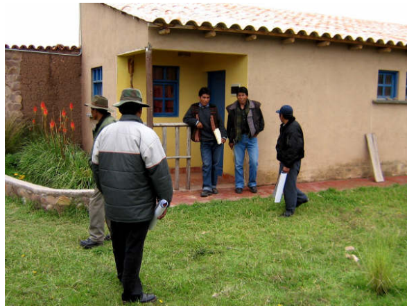
Invirtiendo en un albergue "de energía"