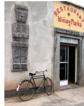
El restaurante de Justino

Justino ya trabaja en coordinación con una agencia de viajes de La Paz y está planeando ampliarse: "a veces los grupos son más grandes y no alcanza el local" .