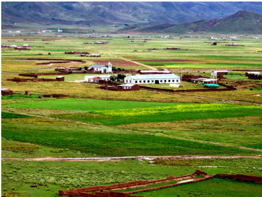
Desde la explanada de Kopallica, se ve el Hospital de Medicina Natural Tradicional

Ahí viene también otra dimensión del encuentro entre el grupo y la Universidad: ésta decidió que, además de agronomía y ganadería, su tercera carrera habría de ser algo como "agro-eco-turismo". Y, en acuerdo entre la Universidad y el PROSAT, una condición para que los miembros del grupo aprueben la calificación de "servicios turísticos" y reciban su certificación fue que arreglen sus casas como para recibir visitantes.