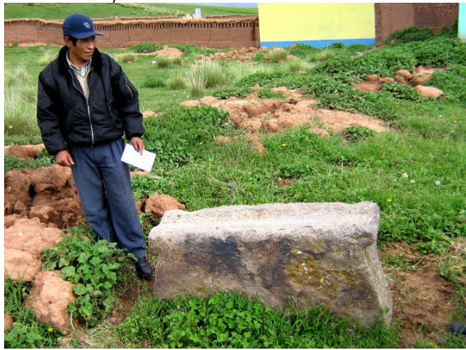
¿Cómo valorizar mejor esta piedra de moler metales?