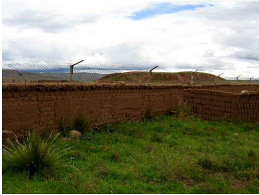
¡Qué lindo sería ver el sitio arqueológico sin muro ni alambre de púa!